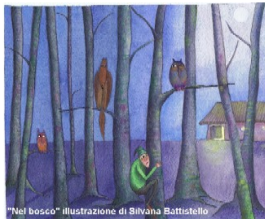
"Nel bosco" illustrazione di Silvana Battistello

Laboratorio espressivo - creativo e animazione alla lettura. Domenica 22 aprile 2012